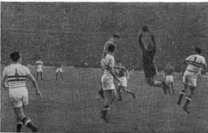
У ворот сборной команды СССР. Венгерские футболисты остро атакуют. Вот они навешивают мяч над штрафной площадью. Создается реальная угроза гола. Но вратарь советской команды Л. Яшин смелым выходом из ворот во-время разряжает опасную обстановку. Он в прыжке кулаком отбивает мяч далеко в поле.